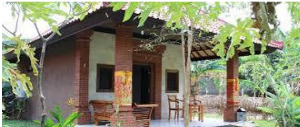
Gambar IV.2 Salah Satu Homestay Yang Berada Di Desa Wisata Pentingsari

dalam atraksi seni dan budaya, 30 pemandu wisata lokal/pemuda, 60 orang dalam kuliner lokal, 20 orang dalam industri rumah tangga, 6 warung kelontong, dan 30 tenaga keamanan/pendukung.