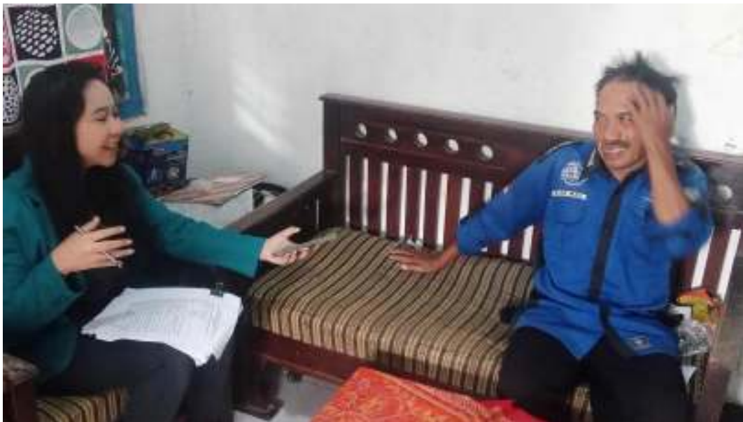
Wawancara dengan Pak dukuh