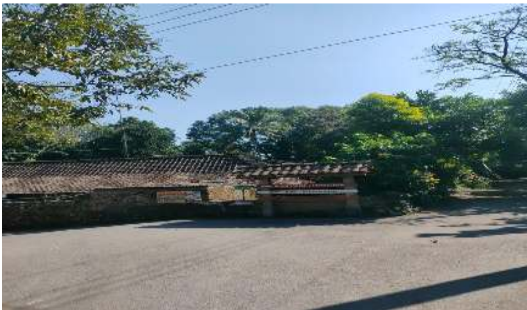
Kondisi Desa Wisata Pentingsari